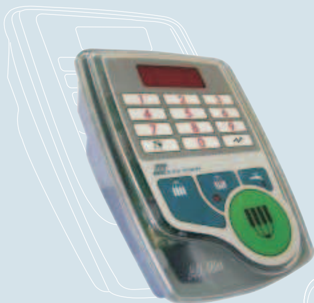
AfiLite Ovládací Panel

Sada efektivních, levných, vzduchem / podtlakem ovládaných ventilů uzavření podtlaku.